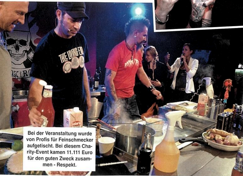
Bei der Veranstaltung wurde von Profis für Feinschmecker aufgetischt. Bei diesem Charity-Event kamen 11.111 Euro für den guten Zweck zusammen - Respekt.