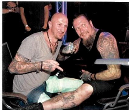
Andy und Ski King präsentieren Skis neues Tattoo, das der Musiker als Höchstbietender ersteigert hatte.