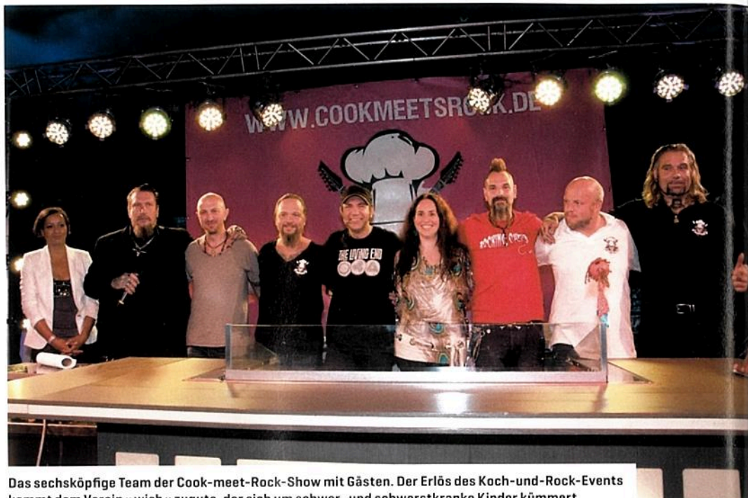
Das sechsköpfige Team der Cook-meet-Rock-Show mit Gästen. Der Erlös des Koch- und Rock-Events kommt dem Verein »wish« zugute, der sich um schwer- und schwerstkranke Kinder kümmert.