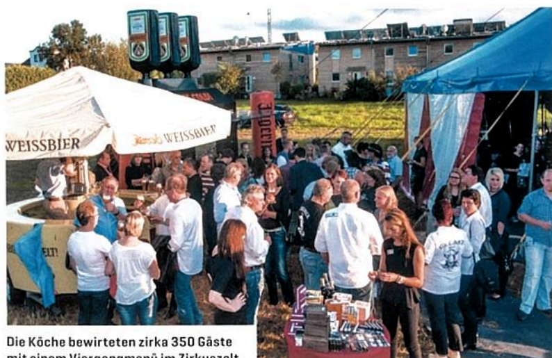
Die Köche bewirteten zirka 350 Gäste mit einem Viergangmenü im Zirkuszelt.

Im schwäbischen Winterbach fand am 20. September das Charity-Event »Cook meets Rock« statt, bei dem Rock 'n' Roll am Mikrophon und Rock 'n' Roll am Herd aufeinandertrafen.